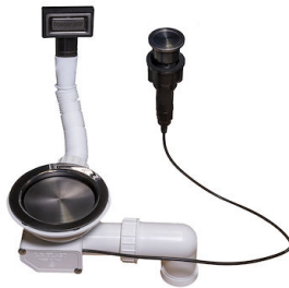
自动下水器 枪黑色 Space - PO 8407 120